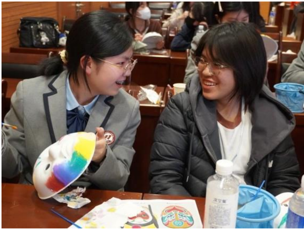
兩地學生一同製作川劇臉譜。