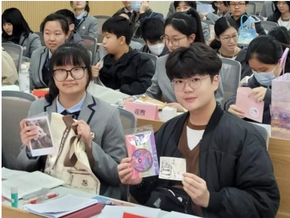
銘基學生與學伴互贈禮物。