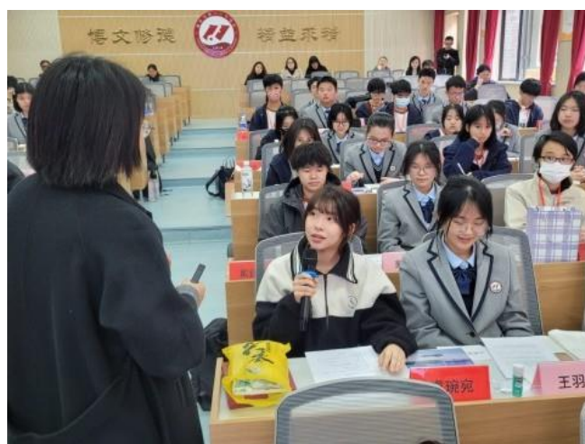
銘基學生參與十一中的課堂。