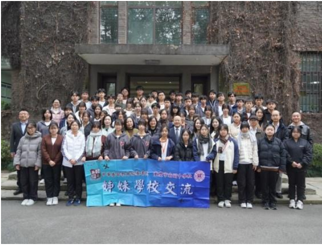
銘基書院師生與重慶市南開中學校師生。