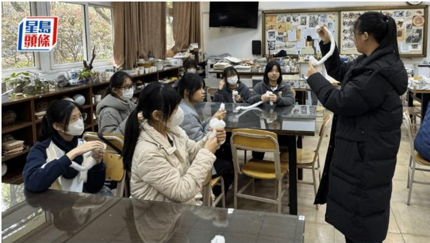
銘基學生與南開學伴體驗手工活動。