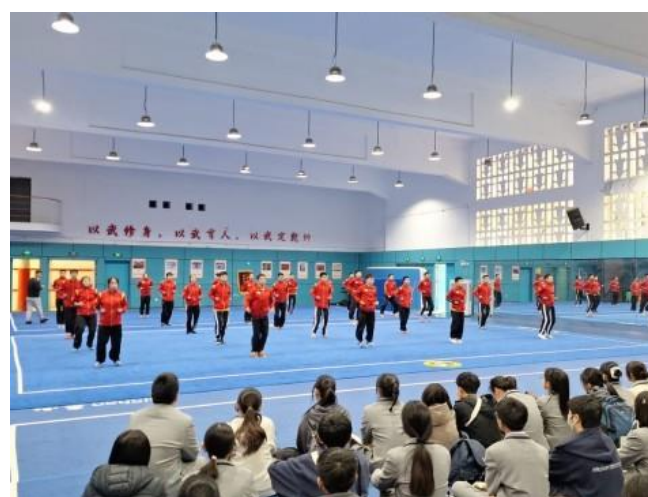
銘基學生欣賞十一中的武術表演。